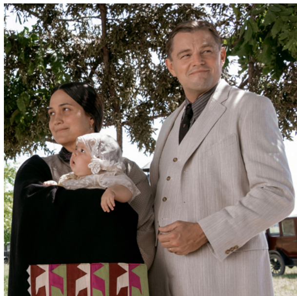
Assassinos da Lua das Flores

• Festival de Cannes 2023 – Seleção Oficial