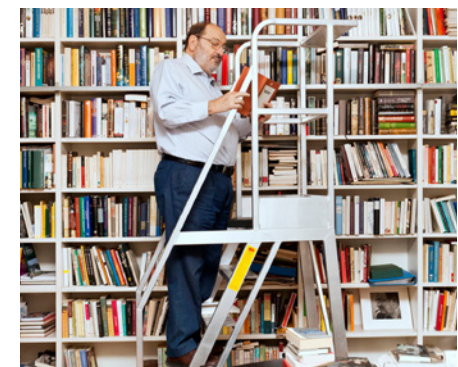
Umberto Eco – A Biblioteca do Mundo

Cahiers du Cinéma ★★★★★ Libération ★★★★★