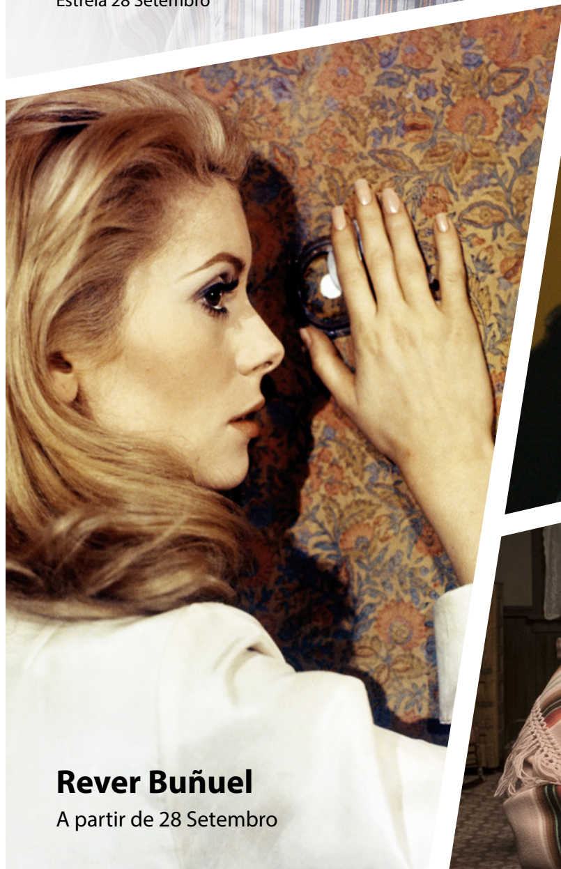
Rever Buñuel A partir de 28 Setembro