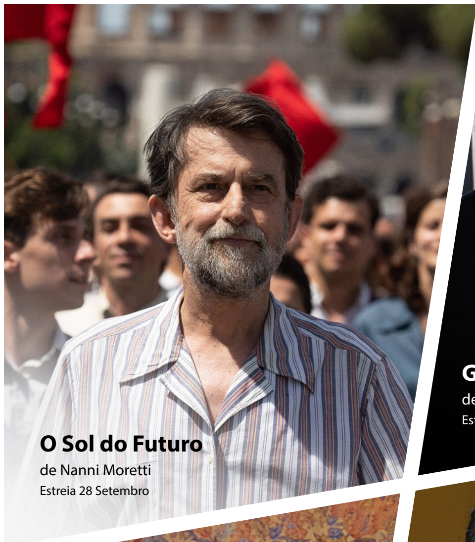
O Sol do Futuro de Nanni Moretti Estreia 28 Setembro

Programa Cinema Medeia Nimas | 43ª edição | 28.09 - 25.10.2023 | Av. 5 de Outubro, 42 B - 1050-057 Lisboa | Telefone: 213 574 362 | info@medeiafilmes.com