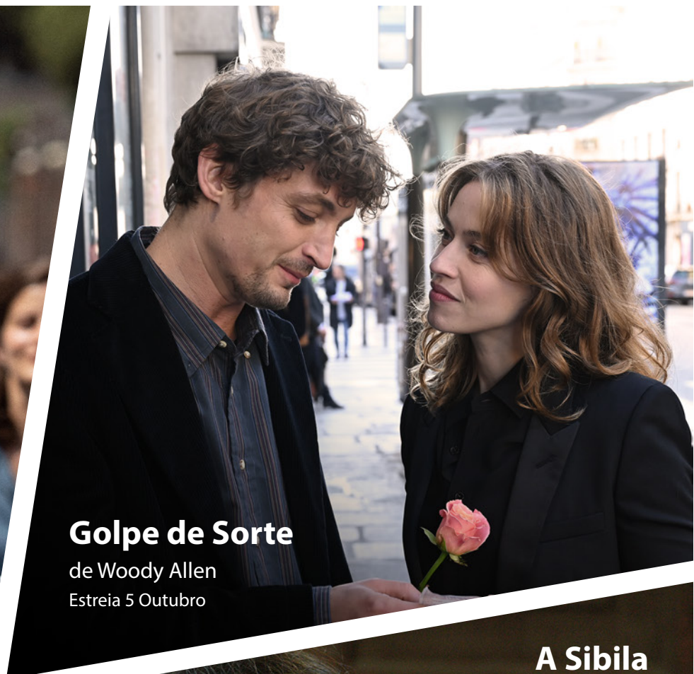
Golpe de Sorte de Woody Allen Estreia 5 Outubro