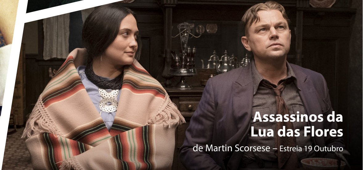
Assassinos da Lua das Flores de Martin Scorsese - Estreia 19 Outubro