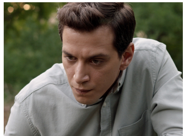
Dias em Chamas