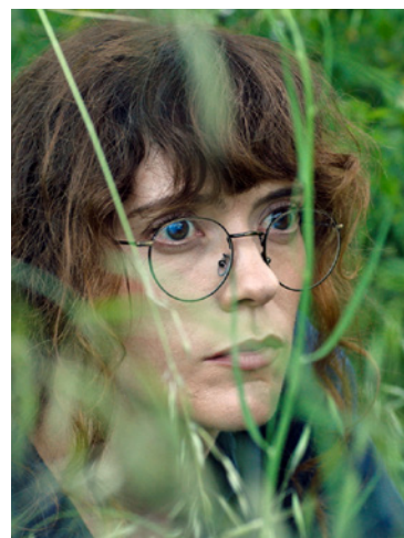
Têm de Vir Vê-la

• Cannes 2022 – Semana da Crítica • Bafta 2023 – Melhor Primeira Obra