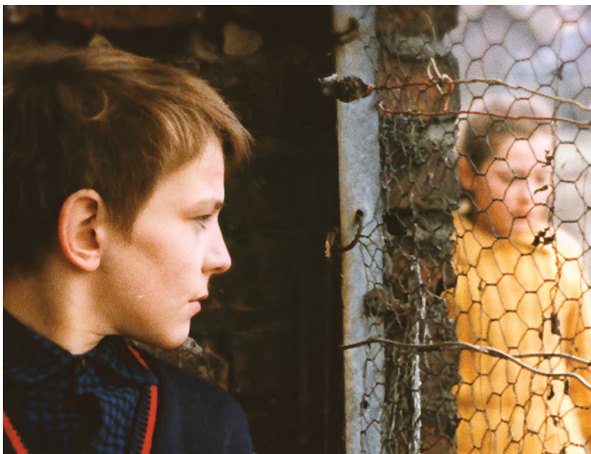
A Infância Nua