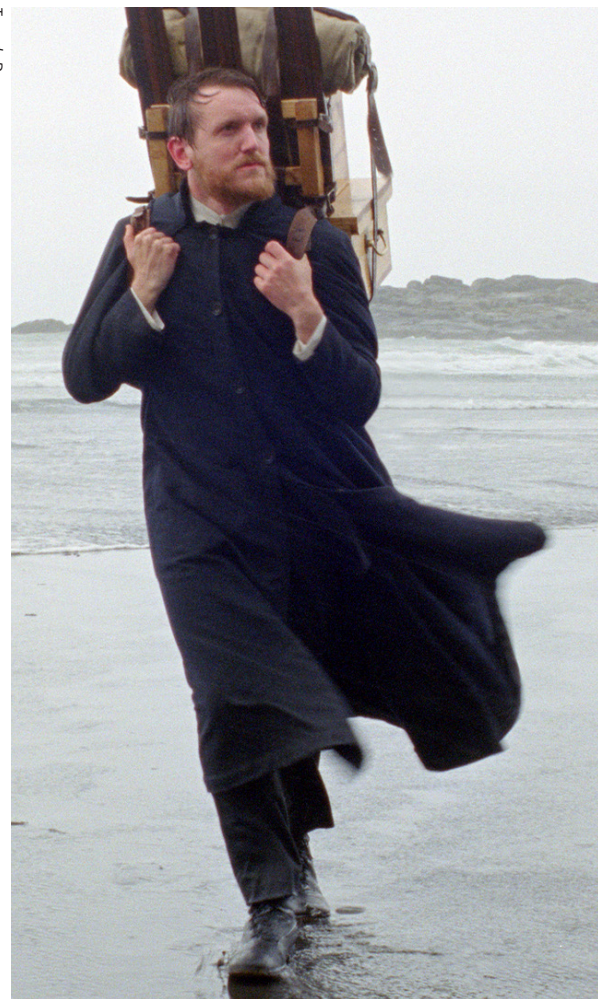
Terra de Deus