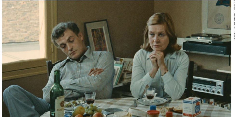
A Vida Íntima de um Casal