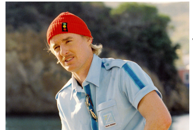
Um Peixe Fora de Água