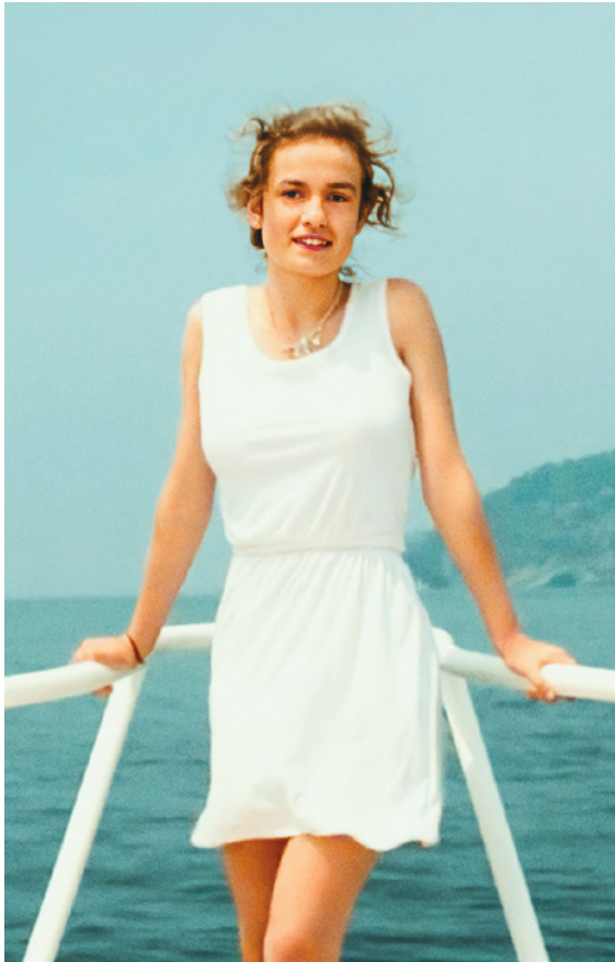
Aos Nossos Amores

"Habitar o olho do ciclone, é o modo como Pialat tenta manter o controlo de um filme, onde, por outro lado, não tem medo de se expor pessoalmente. Entrar nesse olho é o que nos resta fazer." – S.D.