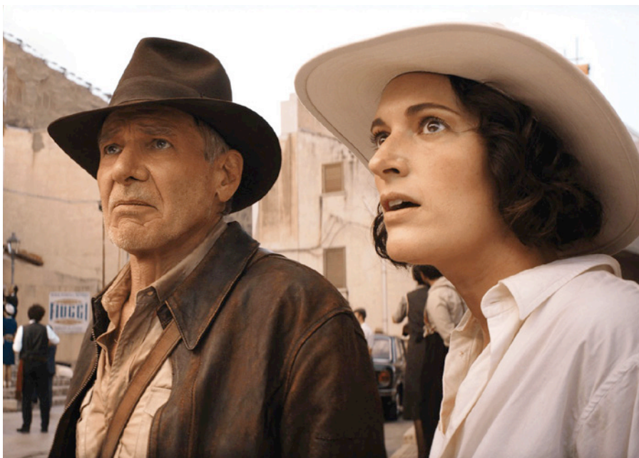
Indiana Jones e o Marcador do Destino

• Festival da Cannes 2023 – Seleção Oficial em Competição