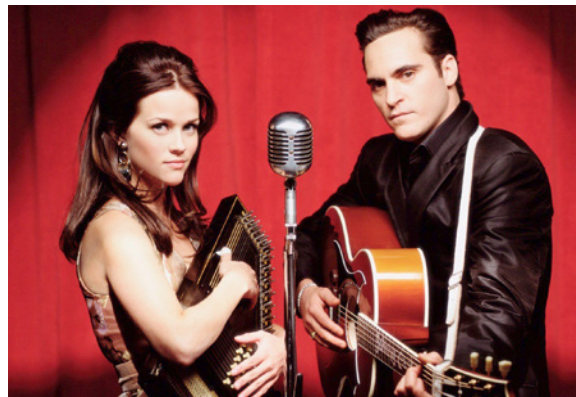
Walk the Line