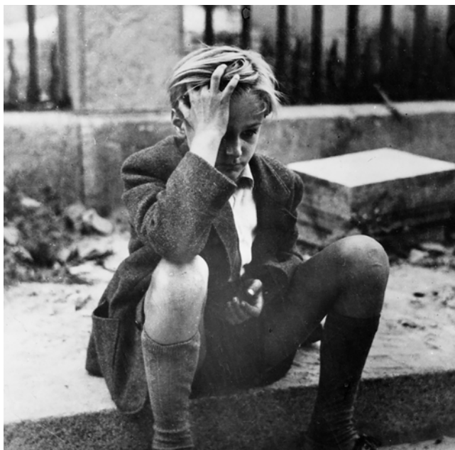
Alemanha, Ano Zero