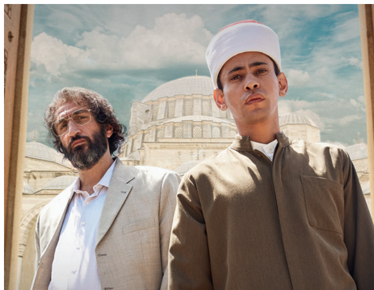
A Conspiração do Cairo

L'Humanité ★★★★★ Positif ★★★★★ Libération ★★★★★