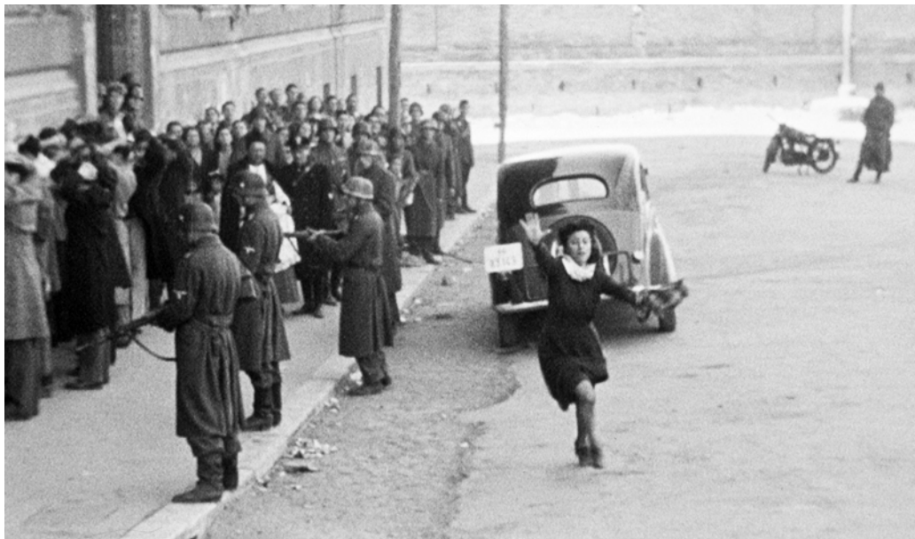
Roma, Cidade Aberta

• Festival de Veneza 1948 – Seleção Oficial em Competição