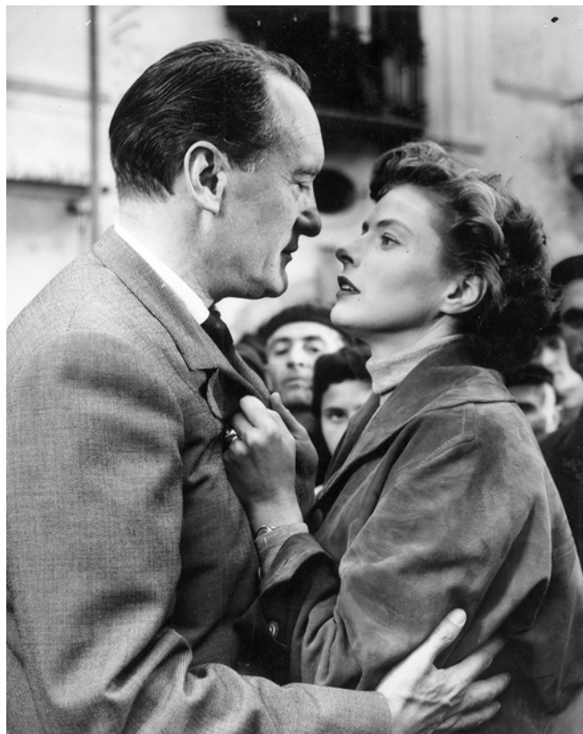
Viagem em Itália

Como diz a frase que serve de subtítulo a este ciclo e que ouvimos no filme de Bernardo Bertolucci Prima della rivoluzione : "Lembra-te, Fabrizio, não se pode mesmo viver sem Rossellini".