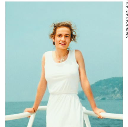
Aos Nossos Amores