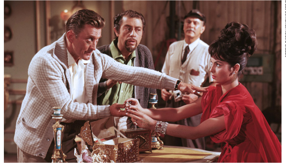
Das Semanas Noutra Cidade

• Festival de Cannes 1966 – Seleção Oficial em Competição