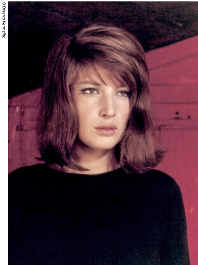
O Deserto Vermelho