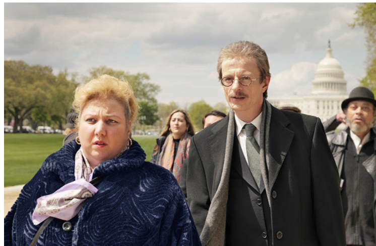
Rabiye Kurnaz vs. George W. Bush