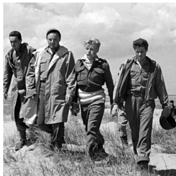
Paisà – Libertação