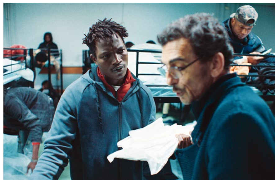
A História de Souleymane