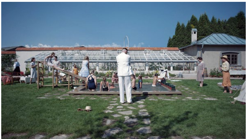
A Zona de Interesse