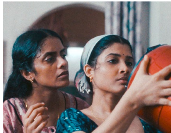
All We Imagine as Light – Tudo o que Imaginamos como Luz