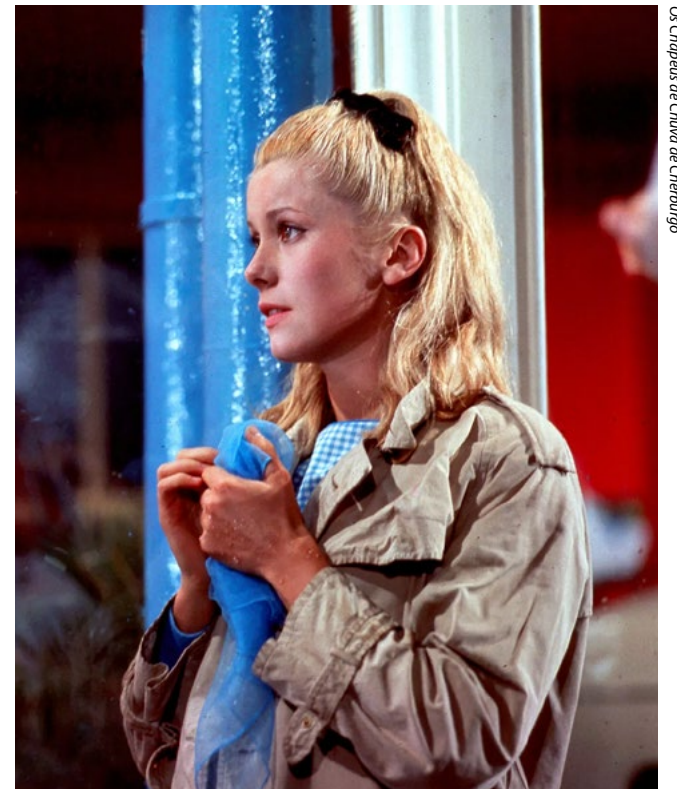
Os Chapéus de Chuva de Cherburgo

“É a história de um mágico que salva a cidade e as suas crianças, enquanto os adultos não entendem nada do que ele tem para dizer... Para mim, é a imagem dos anos 1960-70. Nós, os criadores e artistas, quisemos curar toda uma geração dos males e dos desastres do mundo, aspirando a um mundo melhor.” – Donovan