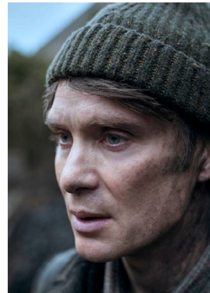
Pequenas Coisas Como Estas