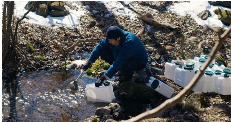
Evil Does Not Exist - O Mal Não Está Aqui

Chegado o final do ano, é tempo de balanço. Há sempre um ou outro filme que não conseguiu ver na estreia, ou que tem vontade de rever. Escolhemos estes como os melhores de 2024. É uma selecção que celebra a riqueza do cinema mundial, com obras de diversas cinematografias. Desde logo, Megalopolis , projecto de vida de Francis Ford Coppola, filme de uma liberdade absoluta como há muito não víamos no cinema; Folhas Caídas , de Kaurismäki, um conto terno de dois "amantes desencontrados"; Anora , vencedor da Palma de Ouro em Cannes, que sedimenta o nome de Sean Baker no cinema contemporâneo; No Interior do Casulo Amarelo , magnífica primeira obra do vietnamita Thien An Pham; Evil Does Not Exist - O Mal não Está Aqui , do japonês Ryusuke Hamaguchi, vencedor do Grande Prémio do Júri no Festival de Veneza; A Zona de Interesse , de Jonathan Glazer, um olhar implacável sobre a banalidade do mal e vencedor do Óscar de Melhor Filme Internacional; As Ervas Secas , de Nuri Bilge Ceylan, filme-súmula do maior nome do cinema turco; e Os Delinquentes , do argentino Rodrigo Moreno, que rapidamente se tornou uma obra de culto. Nesta selecção, incluiríamos também All We Imagine as Light , de Payal Kapadia, agora estreada, e que por isso pode ver nas muitas sessões deste programa que tem nas mãos.