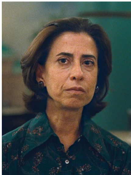
Ainda Estou Aqui