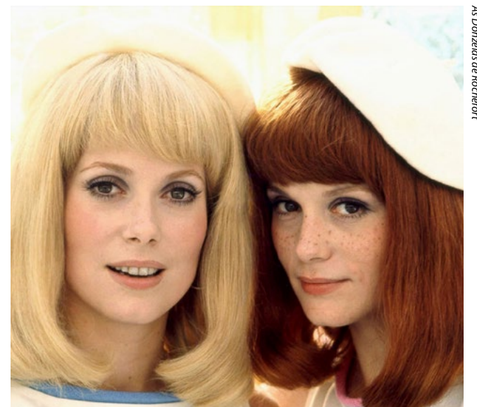
As Donzelas de Rochefort

Os destinos das várias personagens, à procura do amor verdadeiro, perdido ou ainda não encontrado, cruzam-se num jogo de afectos incertos e flutuantes. Catherine Deneuve e a irmã Françoise Dorléac protagonizam esta alegre e colorida homenagem à comédia musical americana, onde Gene Kelly diz: presente.