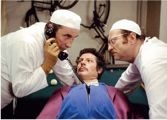
O Acontecimento Mais Importante desde que o Homem Chegou à Lua

Marco / Marcello descobre que está grávido de quatro meses e torna-se internacionalmente famoso, protagonista do que é considerado “o acontecimento mais importante desde que o Homem chegou à Lua”. Surpreendido/a? Há cinquenta anos Jacques Demy criava uma comédia que levanta questões sobre os papéis do homem e da mulher na sociedade e que é também uma espécie de palette pop dos anos 70, a que não falta a cantora Mireille Mathieu.