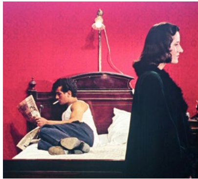
O Belo Indiferente

Um clássico a encantar gerações há mais de 50 anos.