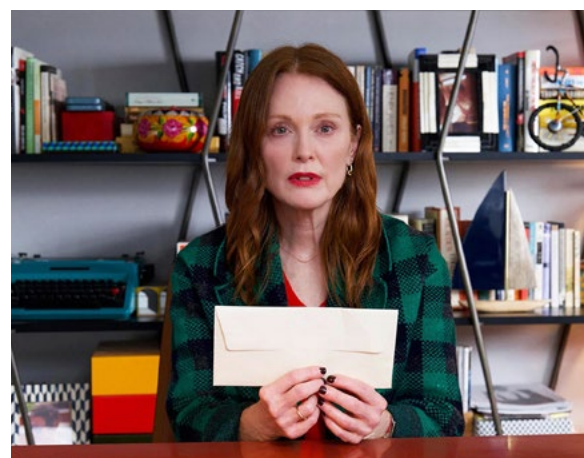
O Quarto ao Lado

É urgente (re)descobrir Mário Pinto de Andrade, a sua história e o seu legado, para uma melhor compreensão das origens da identidade de África.