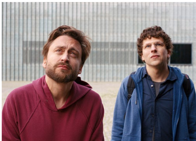
A Verdadeira Dor