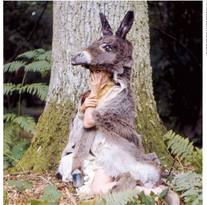
A Princesa com Pele de Burro