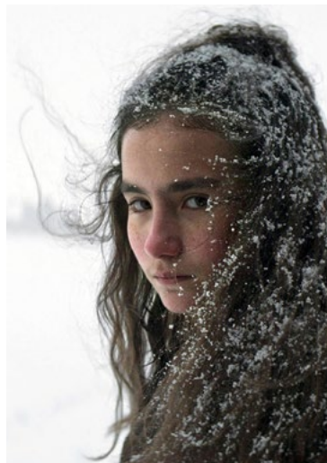
As Ervas Secas