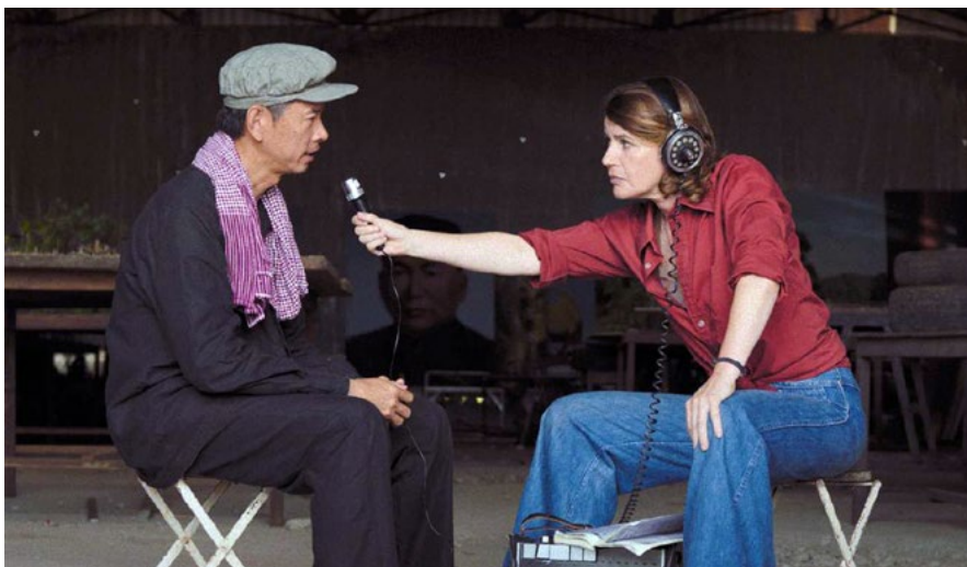
Encontro com Pol Pot

Paris Match ★★★★★ L'Obs ★★★★★ Le Point ★★★★★