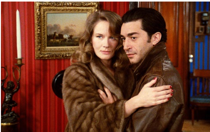
Um Quarto na Cidade

“Há poucos filmes que tenha desejado como este. Poucos filmes que tenha sonhado como este.[...] Nantes é uma cidade que amo verdadeiramente porque sofreu tanto ao longo da sua história. É uma ligação muito forte. [O ponto de partida para o filme] foi uma greve e o amor. A ideia de que temos sempre de nos bater por qualquer coisa. Para viver, ter um salário decente e para guardarmos o nosso amor. Morremos de amor, morremos pelos ideais. São pessoas apaixonadas.” – Jacques Demy