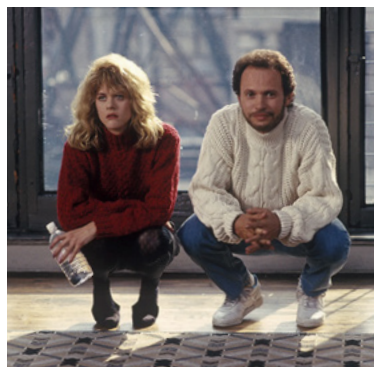
Um Amor Inevitável

Homenageamos Rob Reiner (1947-2025), realizador, produtor e actor, tragicamente desaparecido, com a exibição de três dos seus filmes de culto: Stand By Me (1986), adaptado da novela The Body de Stephen King, e o seu filme mais pessoal; When Harry Met Sally (1989), o filme que veio redefinir a comédia romântica, escrito por Nora Ephron, e que foi um dos seus maiores sucessos; Misery , o favorito do seu amigo e admirador Martin Scorsese.