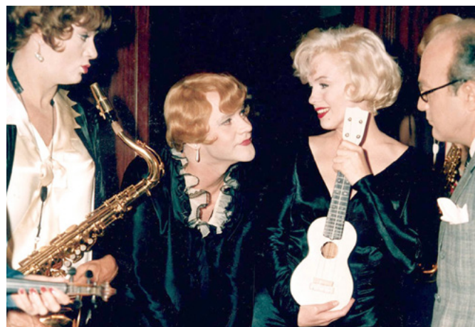
Quanto Mais Quente Melhor

The Seven Year Itch de Billy Wilder com Marilyn Monroe, Tom Ewell, Evelyn Keyes EUA, 1955 – 1h45 | M/12