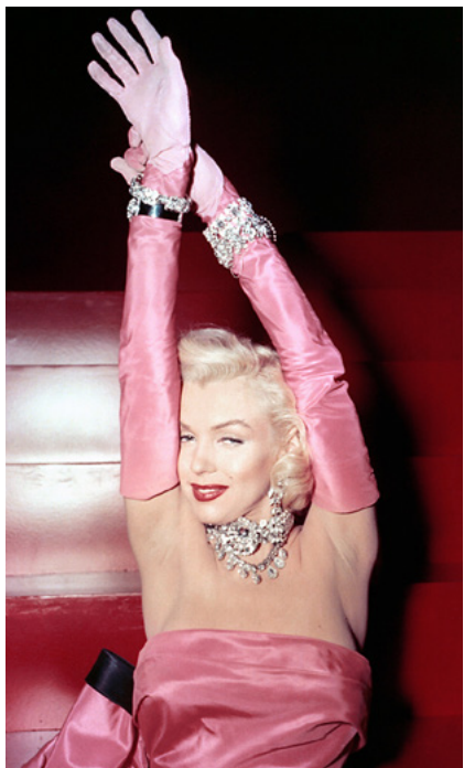
Os Homens Preferem as Loiras

em 1956, outro êxito retumbante, com Paragem de Autocarro , de Joshua Logan – foi ainda o ano do casamento com o escritor Arthur Miller –; contracenou com Laurence Olivier, que também realizou o filme, em O Príncipe e a Corista (1957), e George Cukor dirigiu-a em Vamo-nos Amar (1960), outro prodígio, tragicamente belo , onde reparte a tela com Yves Montand. É o ano do rompimento com Miller, que escreveu o argumento, a partir de uma novela sua, de Os Inadaptados (1961), de John Huston, o realizador com o qual Marilyn tivera a sua primeira presença "visível" e com o qual virá a fazer o seu último filme, ao lado de Clark Gable e Montgomery Clift. Ainda filmou algumas belíssimas sequências com Cukor, para o filme Something's Got to Give , mas o estúdio acabaria por a suspender, devido aos atrasos e às faltas, sintoma de uma crise que dela se apoderava. Até ao momento fatal da noite de 5 de Agosto de 1962, em que, como escreveu Ruy Belo no belíssimo poema "Na morte de Marilyn", " tomou todos os tubos que tinha e não tinha " e " o último dos rostos que mostrou era [...] / um rosto sem regresso mais que rosto mar ".