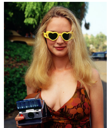
Jogos de Prazer

Os 6 Óscares, entre os quais as almeçadas estatuetas de Melhor Filme e de Melhor Realização, por Batalha Atrás de Batalha , que vêm juntar-se ao facto de Paul Thomas Anderson ser o único cineasta que já venceu o Prémio de Melhor Realizador nos três principais festivais de cinema (Cannes, Embragado de Amor - 2002; Berlim, Haverá Sangue - 2008; Veneza, O Mestre - 2012), justificam o regresso à sua obra singular e incomparável, a impressionar-nos há três décadas. Uma obra eclética e de um rigor irrepreensível, na qual tem vindo a trabalhar com os maiores actores e atrizes - e mesmo a descobrir outros -, exigente, que fez com que PTA se impusesse nos grandes estúdios de Hollywood e como um dos maiores cineastas do presente.