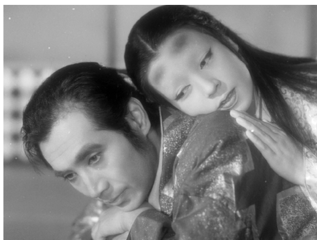
Contos da Lua Vaga

A cinematografia japonesa, uma das mais importantes na história do cinema, foi tardiamente descoberta no Ocidente, com grande espanto e admiração do público cinéfilo, no início dos anos 50, quando Akira Kurosawa recebeu o Leão de Ouro no festival de Veneza, seguido, pouco depois, de mais dois prémios, desta feita para Mizoguchi, um deles por Contos da Lua Vaga (1953). Nos anos finais dessa mesma década, na Inglaterra e nos EUA, ouvem-se as primeiras menções a Ozu, que ficou a ser mais conhecido já iam os 70 bem avançados, quando Viagem a Tóquio (1953) foi finalmente ali exibido comercialmente, tal como na Europa, começando então o enorme culto do cineasta (a estreia comercial em Portugal, deste e de outros filmes de Ozu, só aconteceria há poucos anos, pela mão da Leopardo Filmes. Antes apenas estreara, em 1994, Primavera Tardia , distribuído pela Atalanta Filmes, também de Paulo Branco). Por seu lado, Mizoguchi, realizador de cabeceira da Nouvelle Vague (Godard chamou-lhe “O melhor dos realizadores japoneses. Ou, simplesmente, um dos melhores realizadores do mundo”), teve a crítica francesa a seus pés, quando em 58 os Cahiers incluíram os Contos na lista dos melhores filmes de todos os tempos. São os três grandes mestres desta cinematografia imensa pela qual, temos, desde então, como escreveu Serge Daney ( Maison cinema et le monde ), “uma paixão devoradora”.