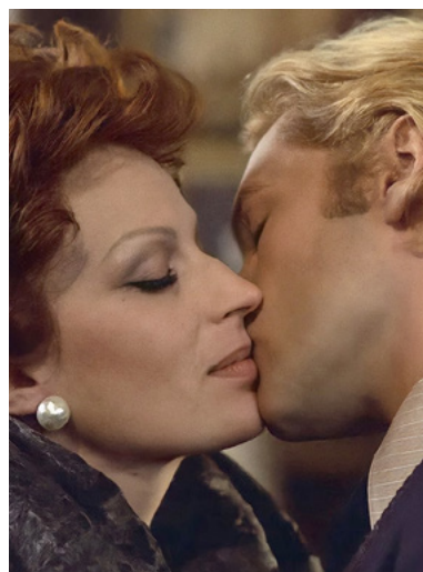
Violência e Paixão