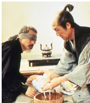
Os Olhos da Ásia

EVIL DOES NOT EXIST O MAL NÃO ESTÁ AQUI Aku wa sonzai shinai 2023 - 1h46 | M/12