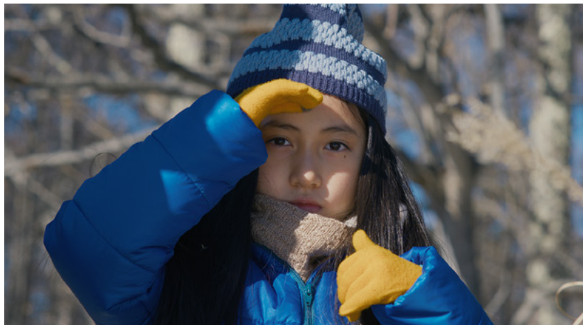
Evil Does Not Exist - O Mal Não Está Aqui