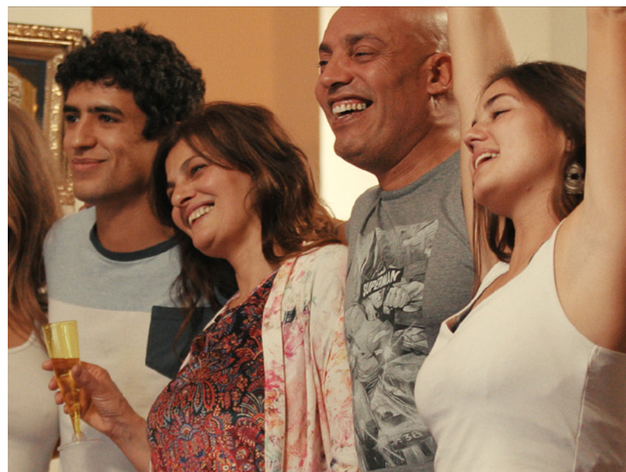
Mektoub, Meu Amor: Canto Segundo