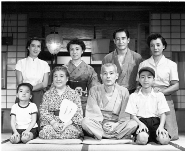
Viagem a Tóquio

os expoentes da Nouvelle Vague japonesa, a “Naberu Bagu”, entre eles Nagisa Oshima, de quem exibimos Contos Cruéis da Juventude (1960), retrato de uma juventude desencantada e rebelde, no meio das revoltas estudantis, que viria a alcançar um enorme sucesso entre o público jovem.