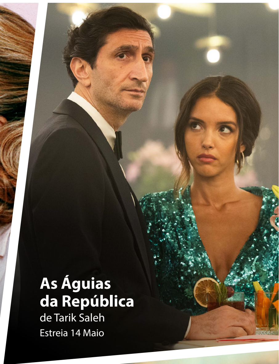
As Águias da República de Tarik Saleh Estreia 14 Maio