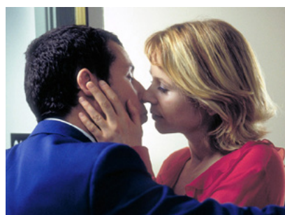
Embriagado de Amor