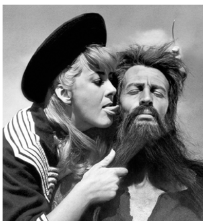
Simão do Deserto