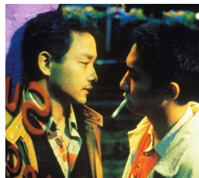
Happy Together – Felizes Juntos

com Leslie Cheung, Tony Leung, Chang Chen Hong Kong, 1997 – 1h36 | M/16 | 4K