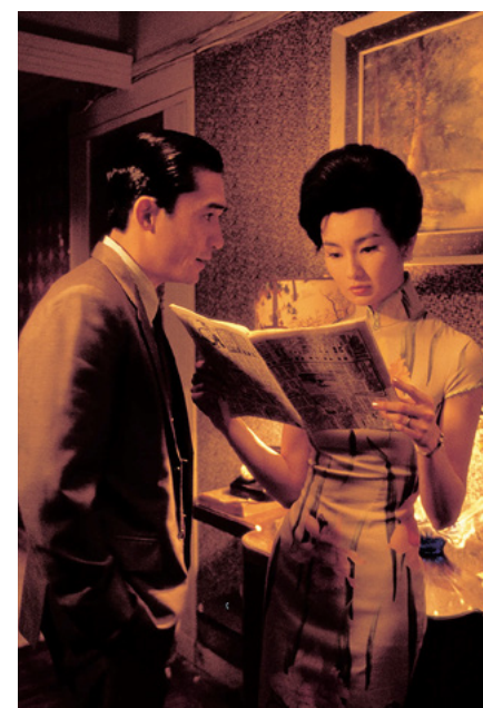
In the Mood for Love – Disponível para Amar

com Nora Jones, Jude Law, Natalie Portman, Rachel Weisz China, Hong Kong, EUA, 2007 – 1h35 | M/12