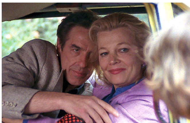
Love Streams - Amantes

Há no mundo três ou quatro cineastas que são a essência do cinema moderno, mas, acima de todos, estará John Cassavetes (1929 – 1989). É, pois, o tempo de regressarmos de novo à sua obra, que influenciou (e continua a influenciar) um sem número de realizadores no mundo inteiro, entre os quais Bogdanovich, Scorsese, Eustache, Pialat, Rivette ou Hamaguchi. Foi, com a atriz Gena Rowlands, com a qual se casou em 1954 e viveu até à sua morte precoce aos 59 anos, um dos pares mais criativos na história do cinema. Foi com ela que fez quase todos os seus filmes, e também com os amigos, como Peter Falk ou Ben Gazzara, impregnados pelo pulsar de uma vida partilhada de forma única. Como escreveu Jim Jarmusch, os seus filmes “são sobre o amor, a confiança e a desconfiança, o isolamento, a alegria, a tristeza, o êxtase e a estupidez. São sobre a inquietação, a embriaguez, a resiliência e o desejo, sobre o humor, a teimosia, as falhas de comunicação e o medo”. São uma extensão da vida e estão, como refere Ray Carney [Cassavetes on Cassavetes], “cheios das suas experiências e dos seus sentimentos mais pessoais [...] Cassavetes está dentro dos seus filmes, e as suas impressões sobre a vida estão em personagens como o Ben, de Sombras, o Richard, de Rostos, o Seymour, de Minnie e Moskowitz, a Mabel, de Uma Mulher sob Influência, o Cosmo de A Morte de um Apostador Chinês, e o Robert de Love Streams”.