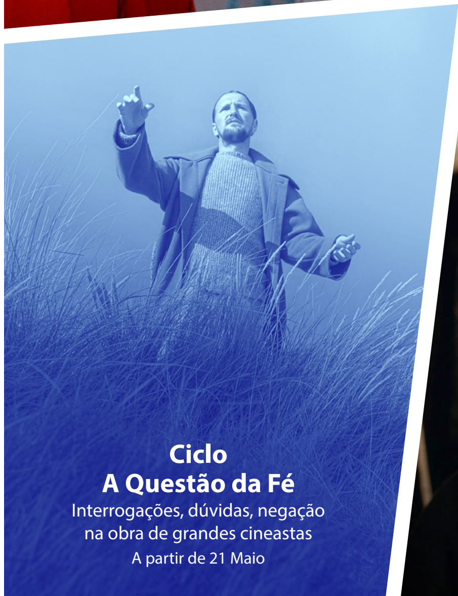
Ciclo A Questão da Fé Interrogações, dúvidas, negação na obra de grandes cineastas A partir de 21 Maio