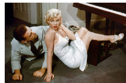
O Pecado Mora ao Lado