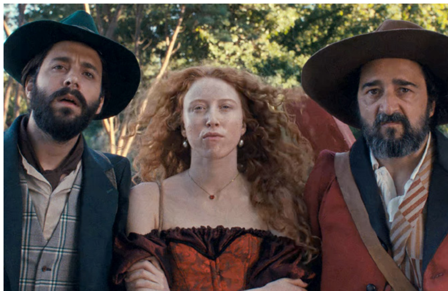
A Providência e a Guitarra

• IndieLisboa 2026 – Competição Nacional