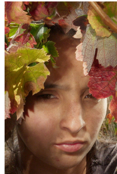
Fogo do Vento

• Festival de Gijón 2024 – Prémio FIPRESCI