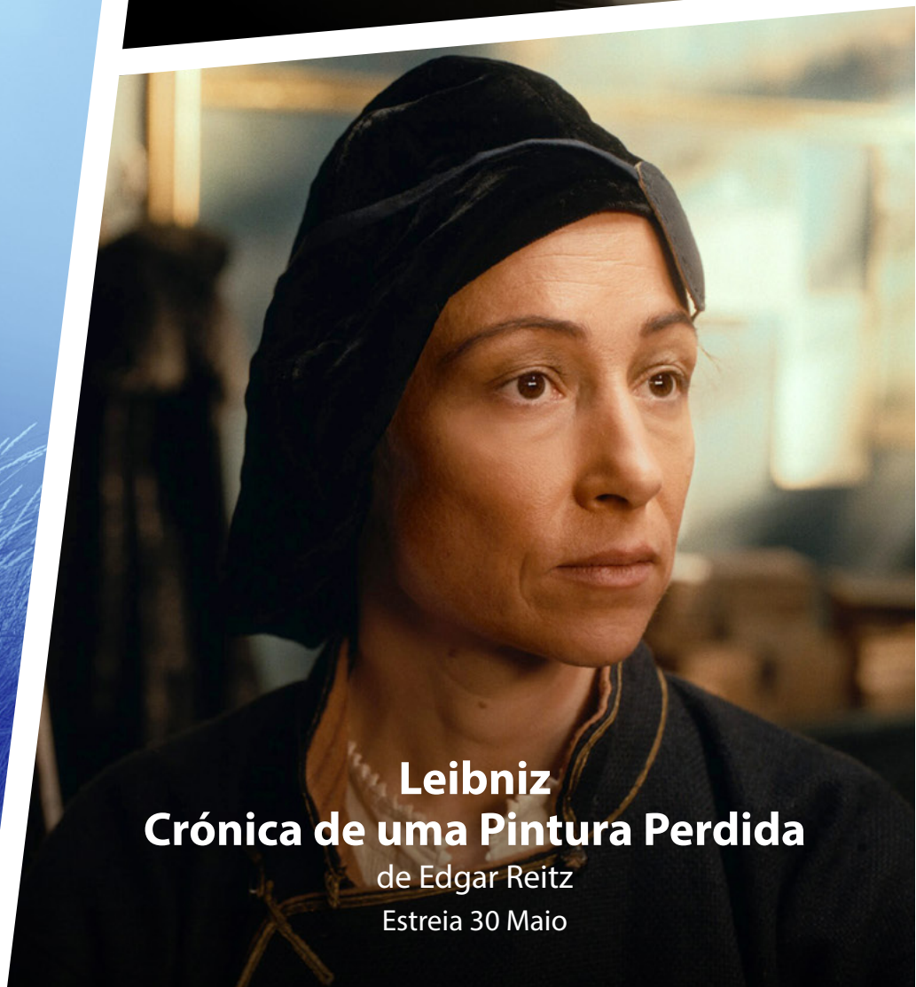
Leibniz Crónica de uma Pintura Perdida de Edgar Reitz Estreia 30 Maio