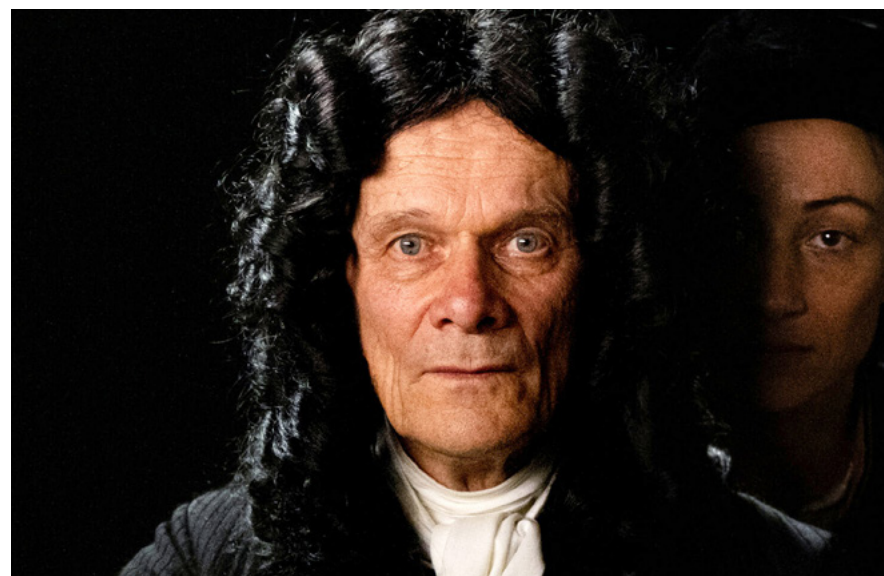
Leibniz - Crónica de uma Pintura Perdida

• LEFFEST – Lisboa Film Festival 2025 – Grandes Mestres