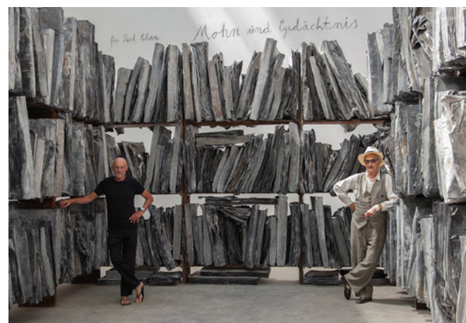
Anselm – O Som do Tempo

A Alemanha, para Kiefer, um dos maiores artistas do nosso tempo, é, parafraseando O'Neill, uma questão que tem consigo mesmo, golpe até ao osso que percorre o seu trabalho, as pinturas e instalações, estabelecendo “correspondências” com as obras dos escritores Paul Ceylan ou Ingeborg Bachmann. Avassalador!