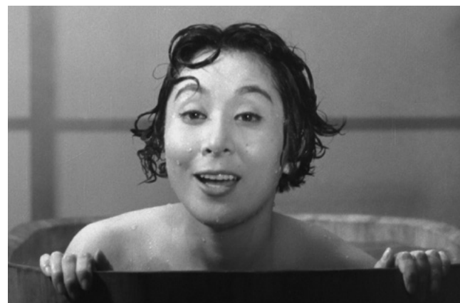
Para Sempre Mulher

Na obra-prima Para Sempre Mulher , Tanaka “parte a louça toda”, como escreveu Inês N. Lourenço no DN , continuando “uma busca pela textura real da figura feminina, o seu traço mais rebelde dentro do idealismo japonês”.