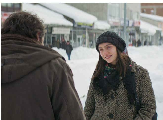
As Ervas Secas

• Festival de Cannes 2023 – Grande Prêmio do Júri