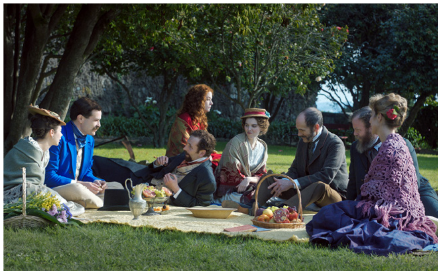
O Pior Homem de Londres