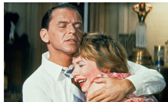
Deus Sabe quanto Amei