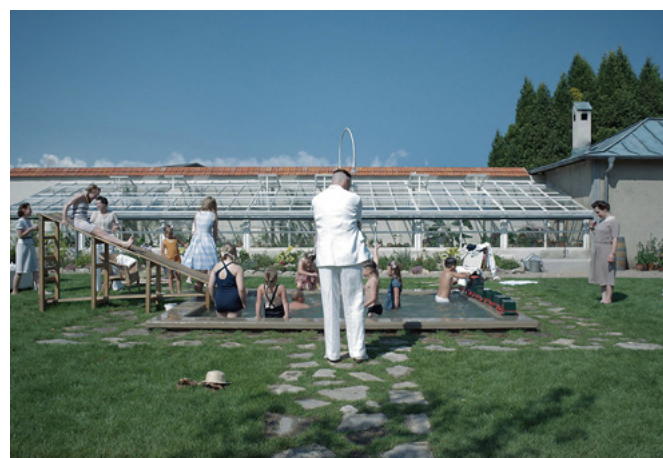
A Zona de Interesse

• Festival de Cannes 2023 – Prêmio do Júri