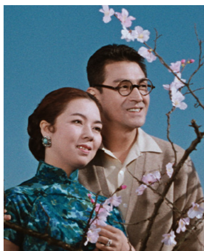
A Princesa Errante

Parte de um argumento de Ozu, um dos seus "projectos não realizados", que este lhe ofereceu. Estão lá os "temas" de Ozu: as questões geracionais, o "novo" Japão vs. a tradição, os planos que servem de pontuação, e até o seu actor de eleição, Chishu Ryu, vistos pelo "olhar" de Tanaka.