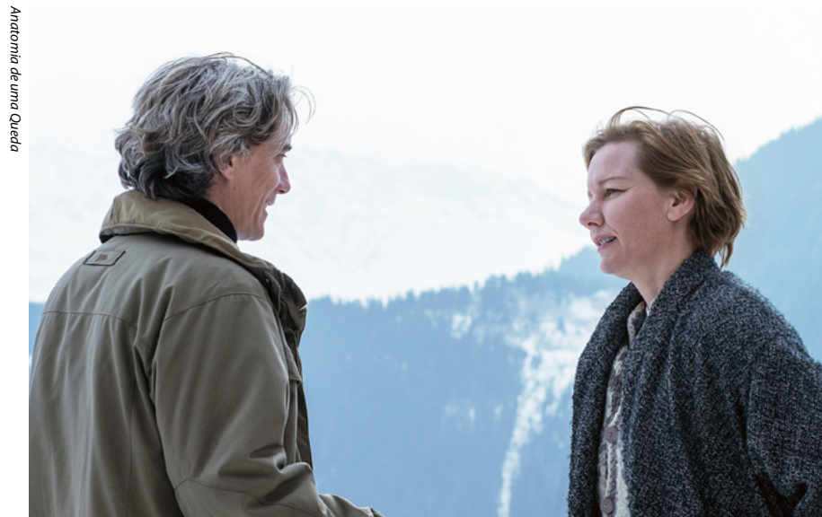
Anatomia de uma Queda

Les Inrocks ★★★★★ Libération ★★★★★ Cahiers du Cinéma ★★★★★ The Guardian ★★★★★