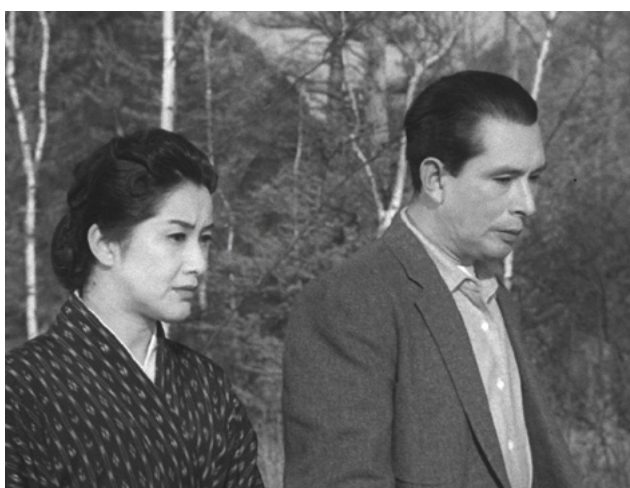
O Som do Nevoeiro

É o terceiro programa da Stone & the Plot a fazer-nos descobrir algumas obras extraordinárias do cinema japonês dos "Mestres Desconhecidos" fora do Japão, resgatando-as do esquecimento e estreando-as finalmente em sala em Portugal.