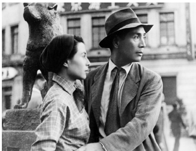
Carta de Amor

Lançado um ano após o fim da ocupação americana do Japão, é a estreia de Tanaka na realização. Os elogios que recebeu em Cannes, foram o impulso para Tanaka continuar.