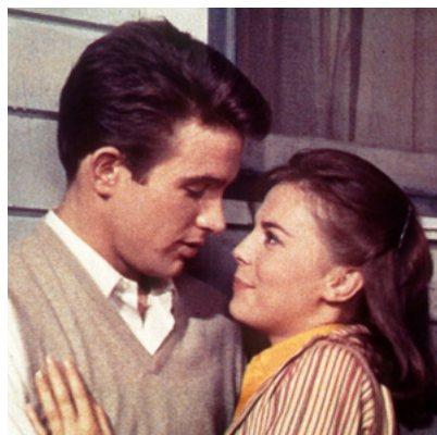
Esplendor na Relva